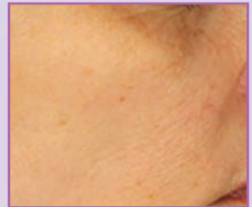
NACH 28 TAGEN